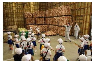
〈野口小学校「まちたんけん」〉