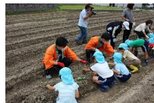
〈野口北幼稚園さつまいも作り体験〉